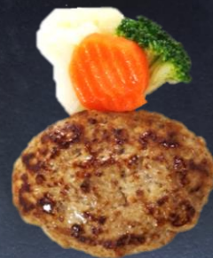
3. 手ごねハンバーグ 550円 80g 990円 160g