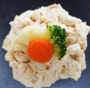
2. 那須鶏のササミ 550円 80g 990円 160g