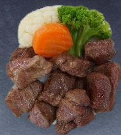
4. サイコロステーキ 990円/80g