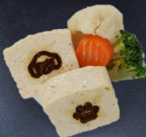
5. 那須鶏ミートローフ 550円/60g