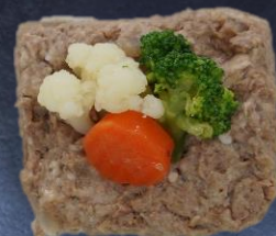
6. 牛すじ肉のペースト 550円 50g