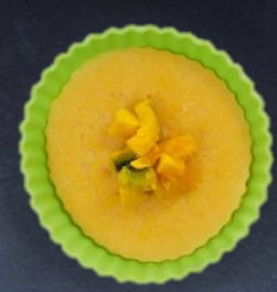
9. カボチャプリン 330円 60g

ご注文：0287-73-6010 ※ご用意に30分ほどお時間頂きます 売上の一部を『SOS活動』に充当させていただいております