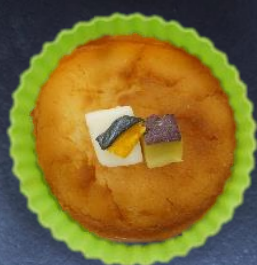
8. 米粉カップケーキ 330円 60g