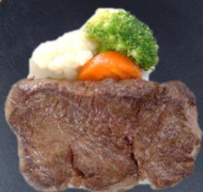
1. 牛フィレステーキ 1,870円 80g